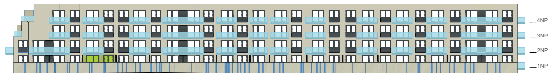
Jižní pohled na dům / Building View - south side